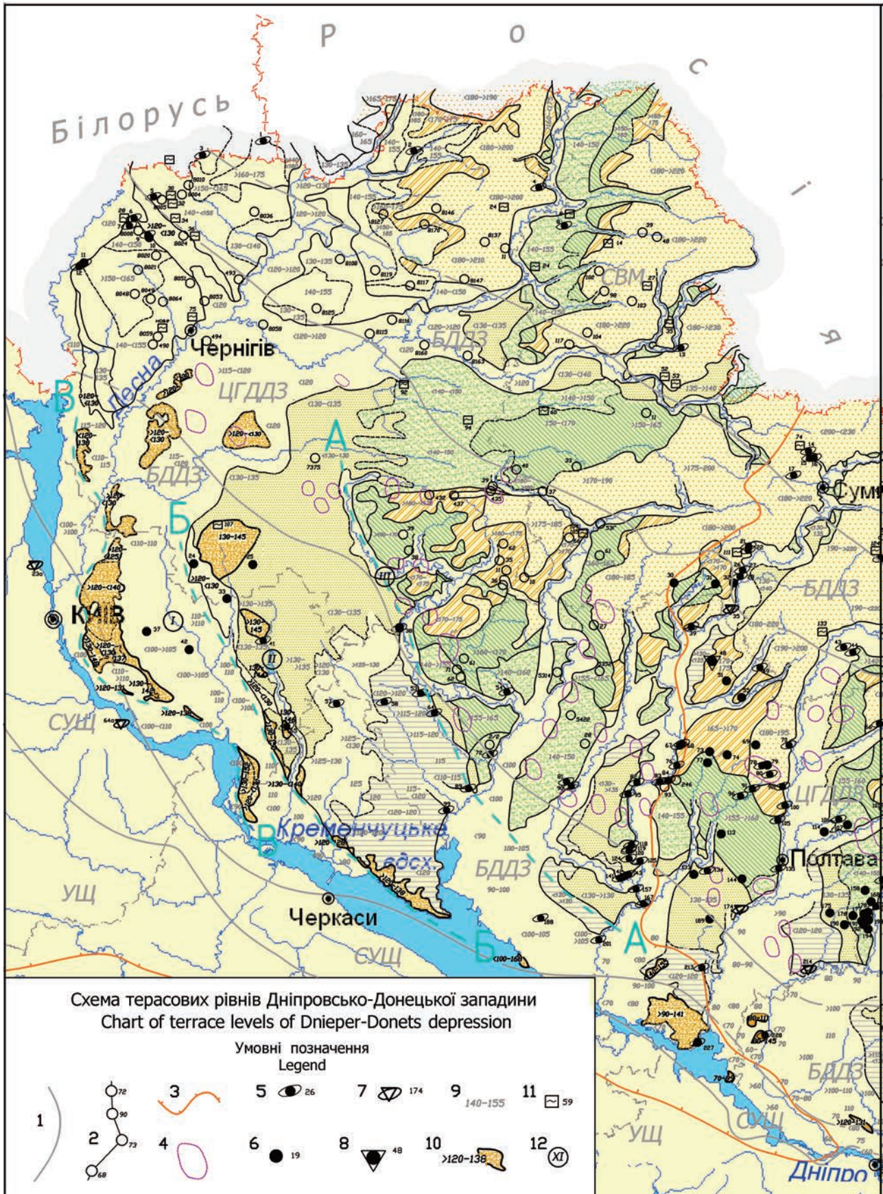
Фрагмент Схеми терасових рівнів Дніпровсько-Донецької западини A fragment of the Scheme of terrace levels of the Dnieper-Donets depression