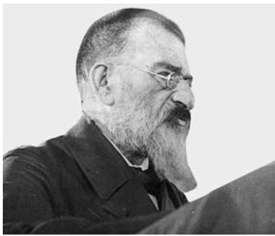
Ювілейне засідання з нагоди 70-річчя П.А. Тутковського 19 травня 1929 р. Останній публічний виступ П.А. Тутковського

соціальними науками, читав підцензурних авторів (Бокля, Спенсера, Пісарєва, Чернишевського), через що, попри успіхи у навчанні, отримав лише срібну медаль і негативну характеристику до Київського університету [Тутковський, 1929].