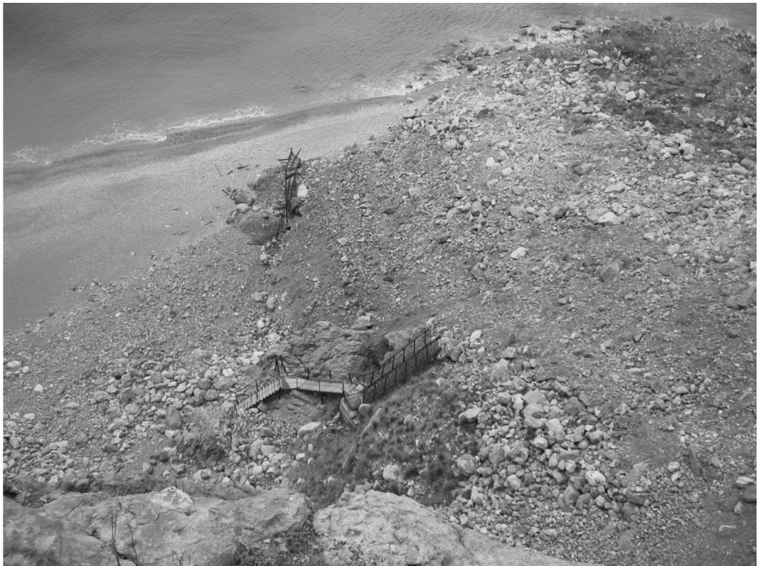
Рис. 3. Языковая часть оползня № 1648 после его катастрофической активизации