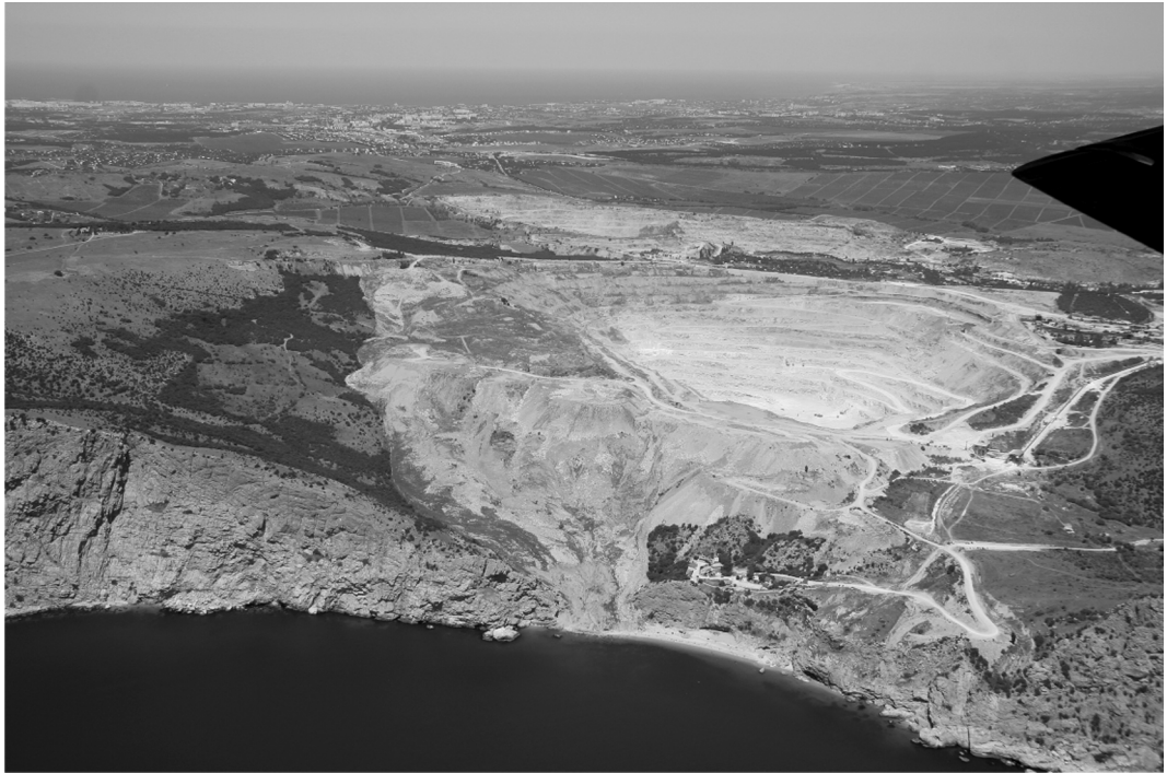
Рис. 2. Техногенный оползень № 1648