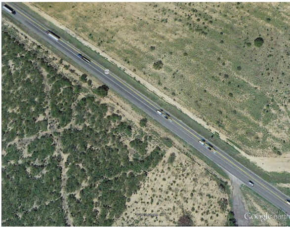
Рис. 1. Рух великовагового транспорту до місць видобування сланцевого газу. Шт. Техас, США

Фрекінг планується проводити у відкладах силуру на глибинах 2-4 км, з поширенням від свердловини тріщин на 200 м. По них вище у відкладі девону надійде якась частина хімічних реагентів, але звідти, очевидно, далеко не поширяться. Проте Одеська ділянка порушена багатьма розломами (рис. 2). І якщо поблизу них здійснювати гідророзриви, то немає жодної гарантії, що під тиском порушення не розкриються і технічні рідини з хімікатами не попадуть до приповерхневих водоносних горизонтів.