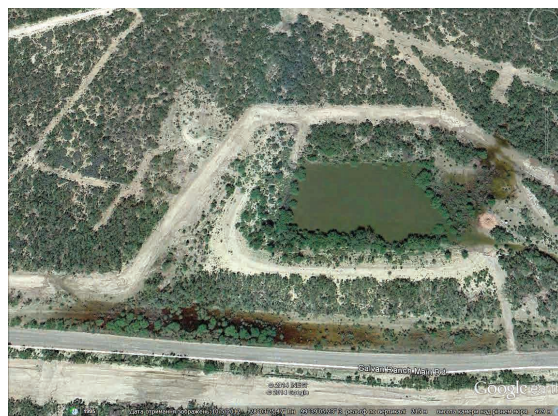
Рис. 3. Покинута амбар для технічної рідини з хімічними реагентами, яка використовувалася для проведення гідророзриву пластів. Шт. Техас, США (фото з Google)

Однак основна екологічна проблема полягає у невизначеності шляхів утилізації рідини для гідророзриву, яка містить багато хімічних речовин, небезпечних для довкілля і здоров'я людей зокрема. В проекті Угоди прямо задекларовано, що використана після гідророзриву рідина буде підніматись на земну поверхню і зберігатись у резервуарах-відстійниках. На рис. 3 видно, що в Техасі відпрацьована рідина з хімікатами знаходиться в амбарах, поки не випарується природним шляхом. Амбари кинуті напризволяще, руйнуються рослинністю, їх вміст розтікається по землі. Зрозуміло, що летючі хімікати попадають в повітря, а розчинені – в ґрунти. Але Техас – безлюдна напівпустеля, де на десятки кілометрів відсутні поселення людей, а Галичина – одна з найнаселеніших територій Європи, де відстань