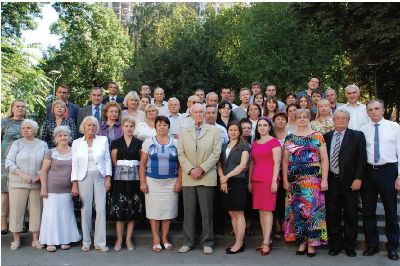
Рис. 3. Співробітники ЦАКДЗ ІГН НАН України, 2016 р.

У Центрі розроблені нові ефективні космічні методи й технології для вирішення ряду актуальних для України завдань раціонального природокористування, зокрема пошуків нафтогазових покладів на суходолі та шельфі, що дозволило майже вдвічі підвищити результативність відповідних робіт. Цю технологію практично апробовано не лише в Україні, але й у колишніх республіках СРСР, Об'єднаних Арабських Еміратах, Марокко та Мавританії; оцінювання стану та врожайності агрокультур; аналізу екологічного стану територій та акваторій у режимі моніторингу; космічного моніторингу тепловтрат на урбанізованих територіях; космічного моніторингу (аудиту) балансу парникових газів та ін.