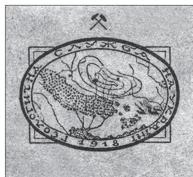
Емблема Українського геологічного комітету, 1918 р.