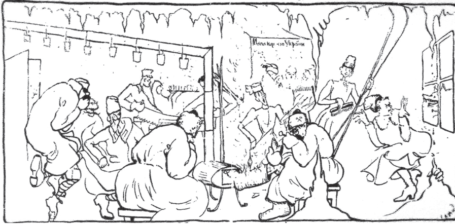
Малюнок-шарж В.В. Різниченка «Кабінетна праця геологів Українського геологічного комітету», 1922 р.

Drawing-cartoon of V.V. Riznychenko "Office work of geologists of the Ukrainian Geological Committee", 1922