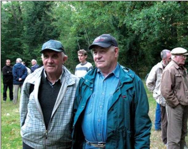
Авторитети української геологічної науки В.М. Шовкопляс і П.Ф. Гожик

Authorities of Ukrainian geological science V.M. Shovkoplyas and P.F. Gozhik