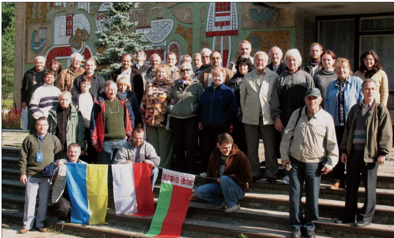
Учасники XIV Українсько-Польського польового семінару «Проблеми середньopleйстоценового інтергляціалу», 12—16 вересня 2007 р., Львів

Participants of the Ukrainian-Polish field seminar “Problems of the Middle Pleistocene interglacial”, September 12-16, 2007, Lviv