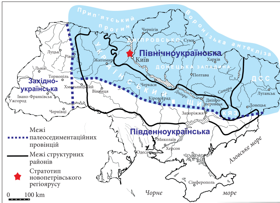
Рис. 2. Місцезнаходження стратотипу новопетрівського регіоарусу Північноукраїнської палеоседиментаційної провінції