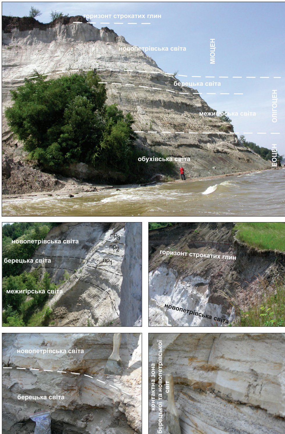
Рис. 3. Відслонення новопетрівської світи біля с. Нові Петрівці Київської області, правий берег Київського водосховища (фото Т.В. Шевченко, 2009 р.)