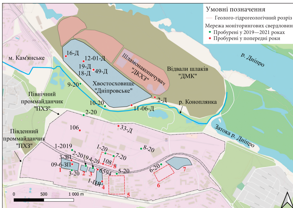
Рис. 1. Ситуаційна схема промислового майданчика ПХЗ і хвостосховища «Дніпровське»: 1 — хвостосховище «Західне»; 2 — відстійник № 220; 3 — відстійник № 230; 4 — хвостосховище «Центральний Яр»; 5 — комплекс радіохімічних цехів; 6 — майданчик розвантаження уранової руди; 7 — хвостосховище «Південно-східне»; 8 — «історичний» відстійник на Північному майданчику