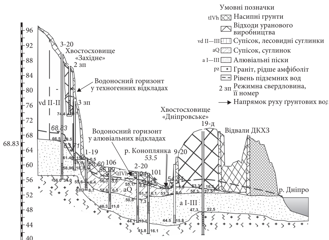
Рис. 2. Геологічний розріз промислового майданчика ПХЗ по лінії хвостосховище «Західне» — р. Коноплянка — хвостосховище «Дніпровське» (лінія розрізу показана на рис. 1)