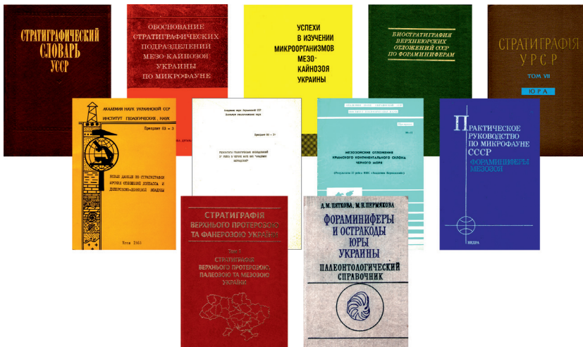
Монографії та препринти за участі та авторства Д.М. П'яткової Monographs and preprints with the participation and authorship of D.M. Pyatkova