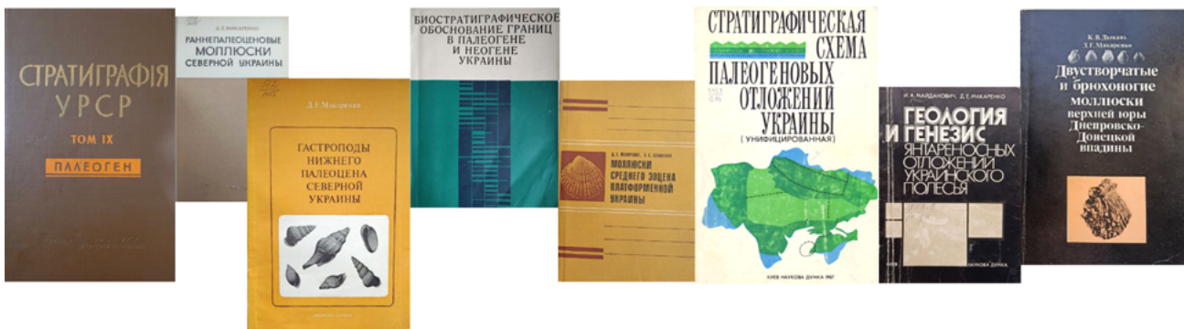
Найвизначніші праці Д.Є. Макаренка The most significant works of D.Ye. Makarenko

Науковий доробок дослідника налічує понад 350 наукових робіт (з них 20 монографій), а також довідники, атласи, брошури, статті, загальна кількість публікацій сягає понад тисячу (Гожик та ін., 2017). Найвагоміші праці Д.Є. Макаренка такі: «Моллюски палеоценовых відкладів Криму» (Макаренко, 1961), у складі авторського колективу Є.Я. Краєва, Д.Є. Макаренко, О.К. Каптаренко-Черноусова, М.М. Ключников, С.І. Пастернак, М.В. Ярцева, Б.Ф. Зернецький, Г.І. Молякко «Стратиграфія УРСР. Т. 9: Палеоген» (Макаренко, 1963), «Раннепалеоценовые моллюски Северной Украины» (Макаренко, 1970), «Гастроподы нижнего палеоцена Северной Украины» (Макаренко, 1976), у складі авторського колективу «Развитие и смена моллюсков на рубеже мезозоя и кайнозоя» (Белякова и др., 1981), у співавторстві з В.О. Зелінською «Моллюски среднего эоцена платформенной Украины» (Макаренко, Зелінська, 1982), в складі колективу авторів «Биостратиграфическое обоснование границ в палеогене северной и экваториальной частей Индийского океана» (Шнюков и др., 1984) та «Стратиграфическая схема палеогеновых отложений Украины» (Зернецкий и др., 1987), у співавторстві з І.А. Майдановичем «Геология и генезис янтареносных отложений Украинского Полесья» (Майданович, Макаренко, 1988), у складі авторського колективу «Геология и нефтегазоносность Днепровско-Донецкой впадины. Стратиграфия»